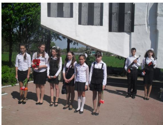
На митинге, посвященном Дню Победы.

Патриотическое воспитание – одно из основных направлений деятельности детской организации. Сложилась давняя традиция проведения митингов у памятника погибшим землякам. Инициаторами этого мероприятия стали мы совместно с администрацией сельского поселения и работниками Дома культуры и библиотеки.