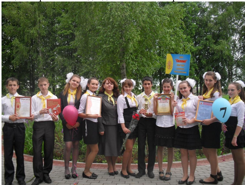
Актив детской организации после праздника Детства.

Самый яркий и запоминающийся всегда Праздник Детства, который мы отмечаем вместе со всеми организациями района и подводим итоги своей работы.