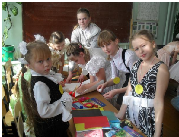
У вожатых всегда найдется время заглянуть к своим друзьям.

Отличительной особенностью детской организации является сотрудничество младших и старших. Старшеклассники с заботой относятся к своим младшим друзьям и во всем стараются им помогать.