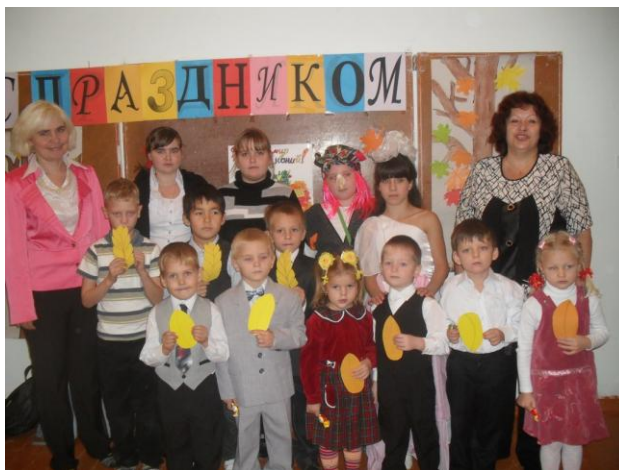
Наши «Зернышки» и «Колоски» с учителями и вожатыми.

Каждый год детская организация пополняется новыми членами. Один из самых любимых праздников – посвящение в «Зернышки» и принятие в «Колоски».