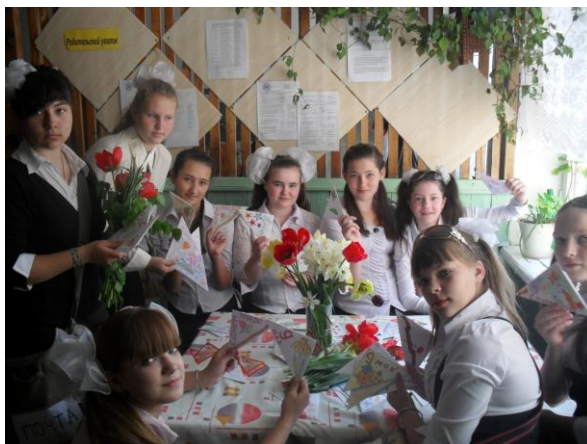
Стартует акция «Письма Победы».

Прижились в нашей детской организации областная акция, посвященная Дню Победы - «Письма Победы». К написанию писем Победы привлекаются все учащиеся 2-9 классов, а почетную роль письменосиц доверяют лучшим членам детской организации.